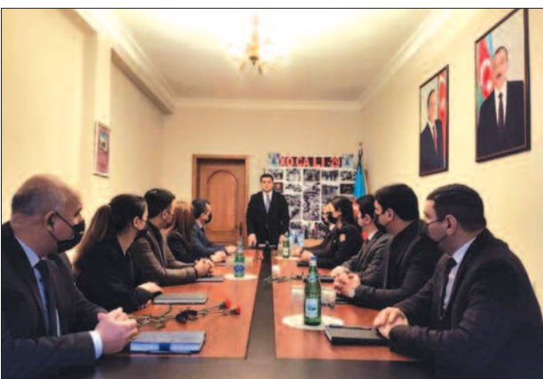
Naxçıvan Muxtar Respublikasının Bakı şəhərindəki Daimi Nümayəndəliyində Xocalı soyqırımının 29-cu ildönümünə həsr olunmuş anım tədbiri keçirilib.

Əvvəlcə Xocalı soyqırımı zamanı qətlə yetirilmiş həmvətənlərimizin və bütövlükdə, Vətən uğrunda canlarını qurban vermiş bütün şəhidlərimizin əziz xatirəsi bir dəqiqəlik sükutla yad edilib.